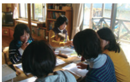
座談会にてスタッフ会議を重ねます

Dr.カフェは、市民と医師が垣根を越えたパートナーシップを築いていくために企画されたワークショップ。市民は日頃を受診で聞きにくいことが気軽に質問でき、医師は診察では聞けない思いに耳を傾けることができます。Dr.カフェは市民と医師が理解し合い、地域医療の発展に繋がってほしいという願いが込められています。「新米パパママはもちろん、おじいちゃんおばあちゃん、医療や保育を学ぶ学生さんなど子育てに関わるすべての人に参加してもらえたら嬉しいですね!」と意気込むすこやかメンバーさんたち。Dr.カフェでお医者さんと仲良くなり、安心して子育てできる山口を作って行きましょう!