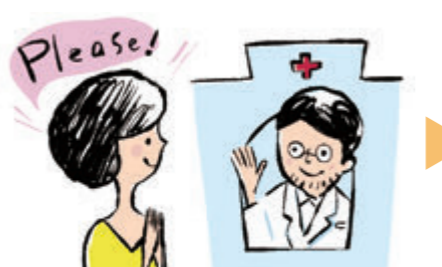
お医者さんにカフェ出席を依頼します