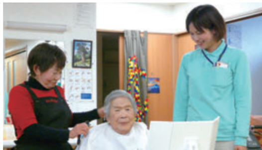
お化粧を終えて。みんなニコニコです。

この日はホワイトボードで化粧の仕方を説明しながら1時間、会員4名が利用者一人ひとりにメイクを施していきました。だんだんお顔がきれいになっていき、鏡をのぞき込む表情がみるみる晴れやかに！見ているこちらまで笑顔になり、その笑顔が周りに広がっていくのが印象的でした。みなさん「気持ち良かった」「気分が明るくなった」と、とてもうれしそう。中には「今日を楽しみにしてきました。早く同居している娘に見せたいです」と涙ぐんでいる方も。心までほっこり温かくなった1日でした。(石田)