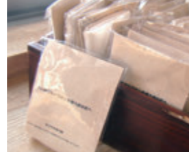
無漂白の布ナプキン1枚 300円